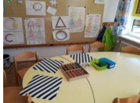
Zeichnen + Malen