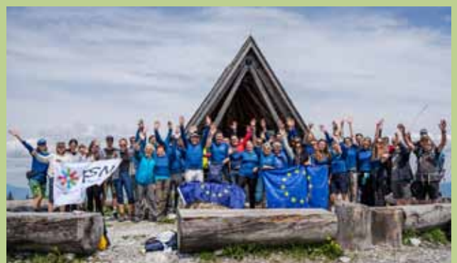
„EU-Gipfeltour“ am Schöckl

tik (ÖGfE) unternahmen heuer in allen österreichischen Bundesländern „EU-Gipfeltour“-Wanderungen, um über aktuelle EU-Themen zu diskutieren. Am