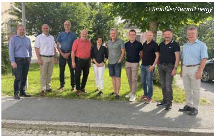
Die „Steuerungsgruppe“ der KEM-Region Schöcklland