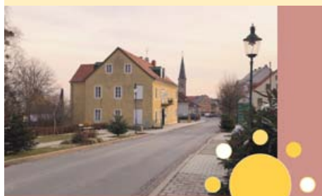
Orts(t)räume ... Workshop im Rahmen einer Diplomarbeit

Anfang März freue ich mich wieder auf einen Termin in der Gemeinde! Der Fokus in diesem von mir gestalteten Workshop „Orts(t)räume“ wird auf der Visualisierung von (bisherigen) Wünschen und Ideen liegen. Ziel ist es dabei, ein besseres Gefühl für den vorhandenen Raum zu entwickeln und die Wirkung verschiedener Maßnahmen zu sehen.