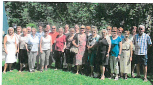
Die TeilnehmerInnen an der „St. Radegunder Blumenfahrt 2015“