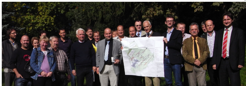
Die Anwesenden bei der Bauverhandlung für den Neubau des Rehasentrums.