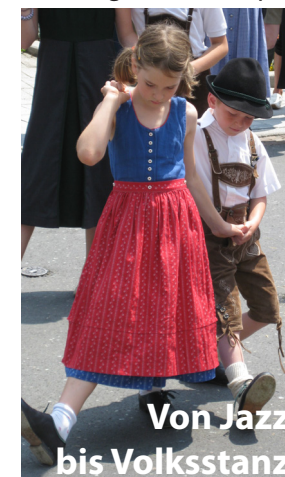
Ein Höhepunkt des 12. St. Radegunder Dorffestes war der gemeinsame Auftritt der Kindertanzgruppe mit der Volksstanzgruppe des ÖKB.