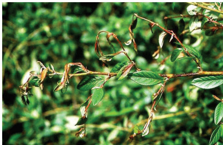
Triebspitzen hakenförmig nach unten gekrümmt

Weitere Informationen unter: www.feuerbrand.steiermark.at