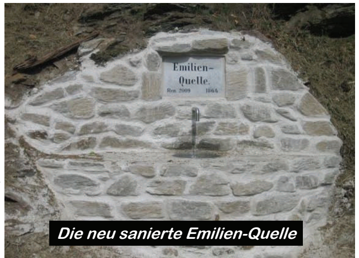
Die neu sanierte Emilien-Quelle